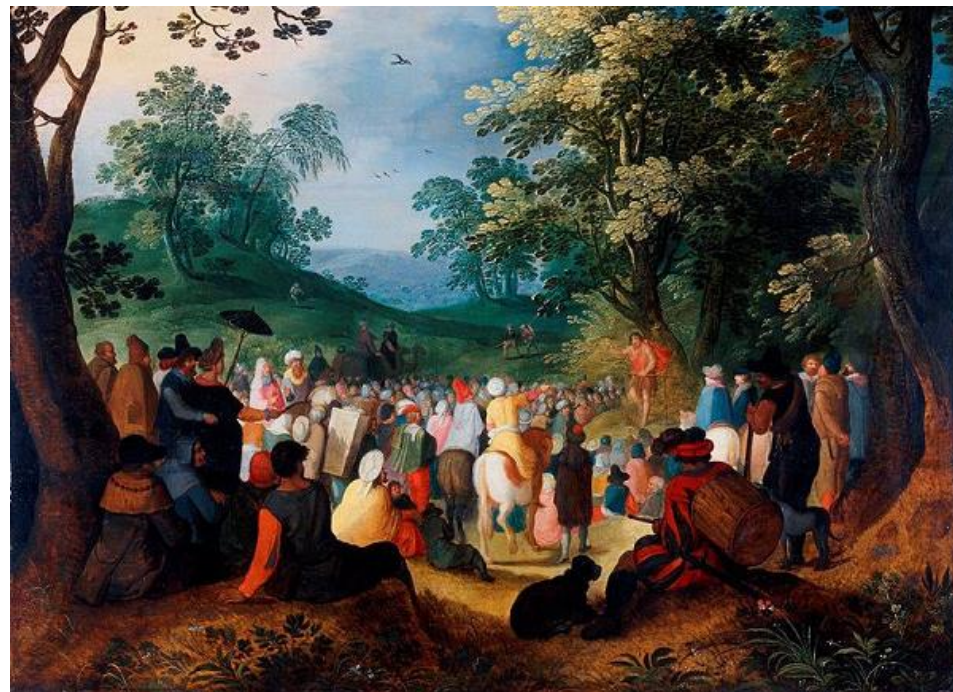
Nicolaes de Bruyn: Kázání sv. Jana Křtitele

Lidé byli plni očekávání a všichni ve svých myslích uvažovali o Janovi, není-li on snad Mesiáš. Na to Jan všem řekl: „Já vás křtím vodou. Přichází však někdo silnější než já; nejsem ani hoden, abych rozvázal řemínek jeho obuvi; on vás bude křtít Duchem svatým a ohněm. Lopata je v jeho ruce, aby pročistil svůj mlat a pšenici shromáždil do své sýpky; ale plevy spálí ohněm neuhasitelným.“ A ještě mnohým jiným způsobem napomínal lid a kázal radostnou zvěst.